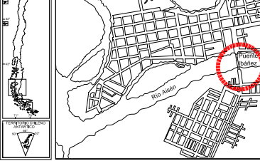
Lámina: 1 de 1 Fecha: Plano CMN N°: